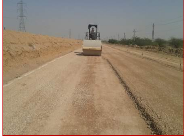
किमी 32+500 पर जीएसबी लगाना/रोलिंग