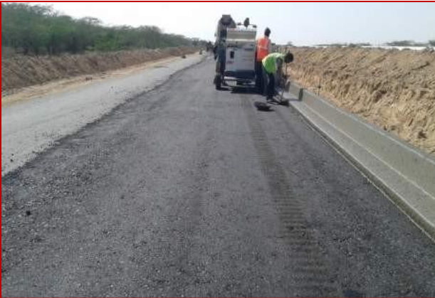
किमी 15+000 पर मेडिन कर्ब लगाना/रोलिंग