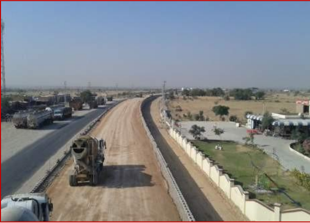
किमी 17+500 पर आरई वॉल/बैकफिसलिंग