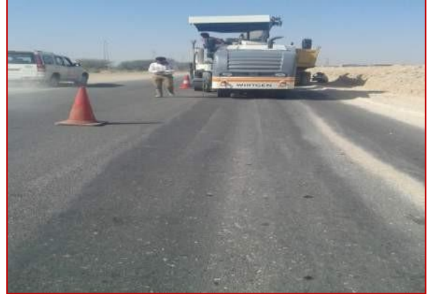
किमी 18+300 पर मिलिंग कार्य