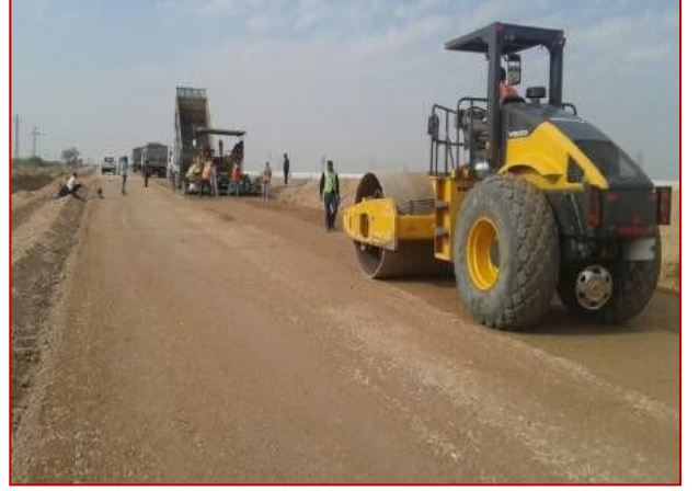
किमी 33+00 पर डब्ल्यूएमएम लगाना/रोलिंग