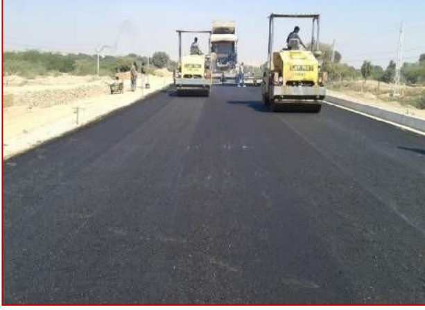
किमी 52+00 पर डीबीएम बिछाना