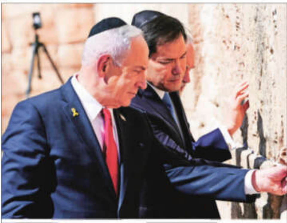
US Secretary of State Marco Rubio and Israeli Prime Minister Benjamin Netanyahu visit the Western Wall, Judaism's holiest prayer site, on Sunday

happened," he said. "We're gonna meet with them (the Israeli leadership). We're gonna talk about what the future holds," Rubio said before heading to Israel where he will stay until Tuesday.